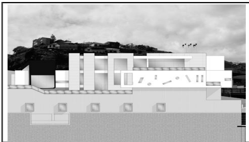
Figura I – Maquete do projecto de construção da BMCL